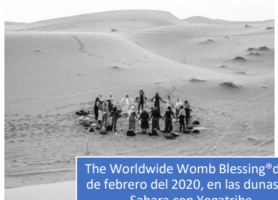
The Worldwide Womb Blessing® del 9 de febrero del 2020, en las dunas del Sahara con Yogatribe.