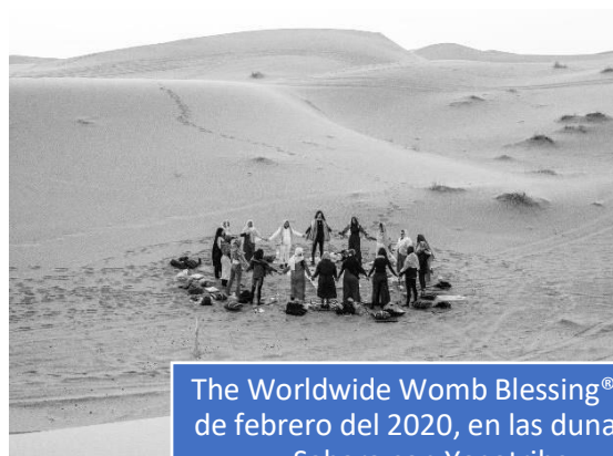
The Worldwide Womb Blessing® del 9 de febrero del 2020, en las dunas del Sahara con Yogatribe.