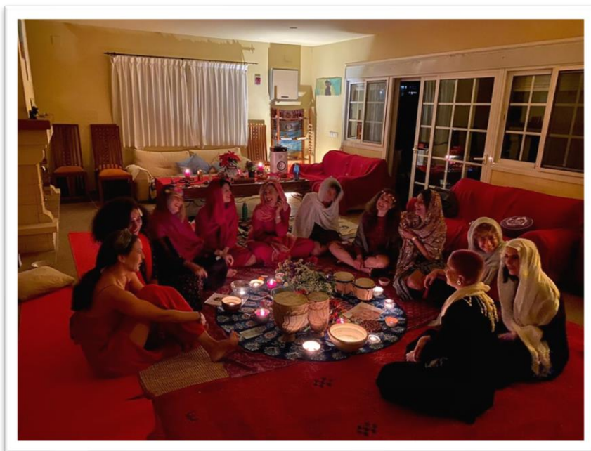
CÍRCULOS DE MUJERES #MALAGA