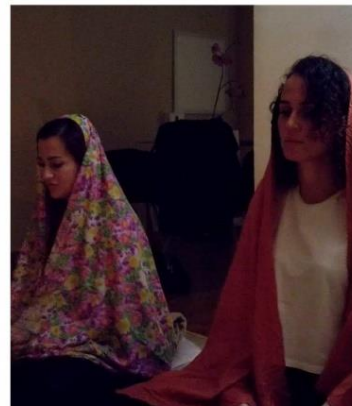
RECONCILIARSE CON LA FEMINIDAD ES UNA PODEROSA VÍA PARA SER FELIZ.