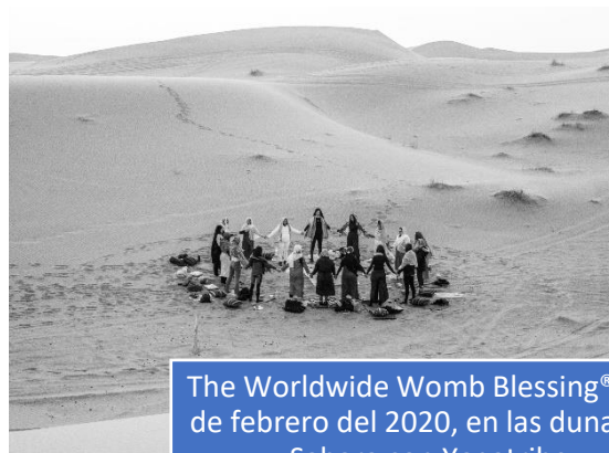
The Worldwide Womb Blessing® del 9 de febrero del 2020, en las dunas del Sahara con Yogatribe.